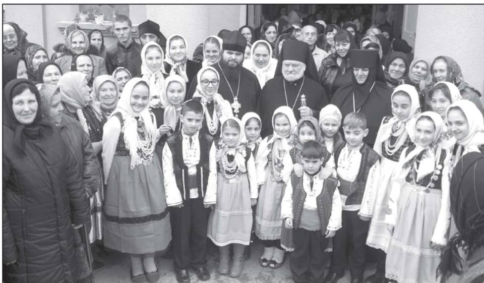
Църковен хор на малките певци