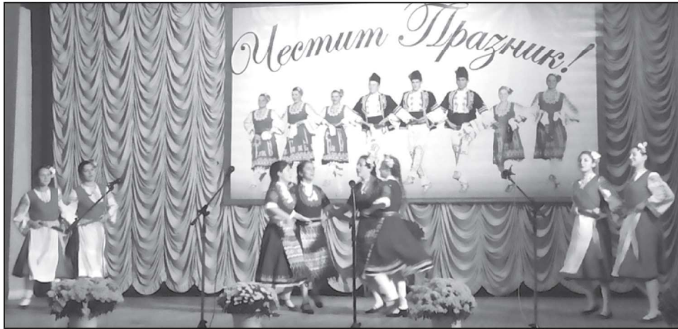
Танцьорите от Двореца на културата

те села, както и епископ Кахулски и Комратски Анатолий.