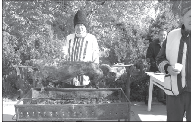
Печено агне - единият от символите на празника.