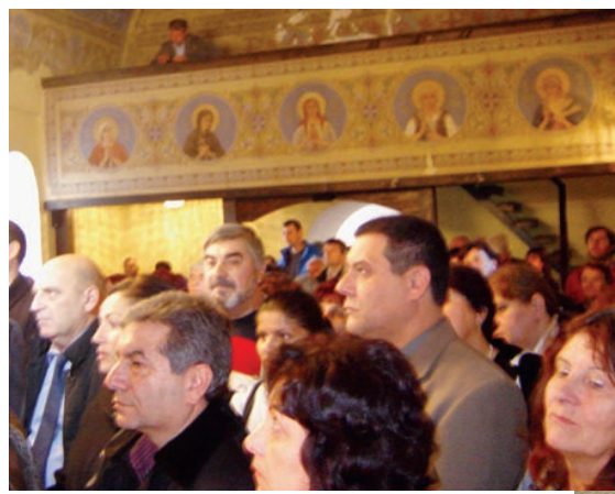
Част от официалните гости на празничната литургия.