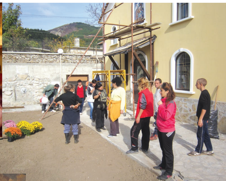
Доброволен труд за довършване на работата дадоха жителите на Козарево.