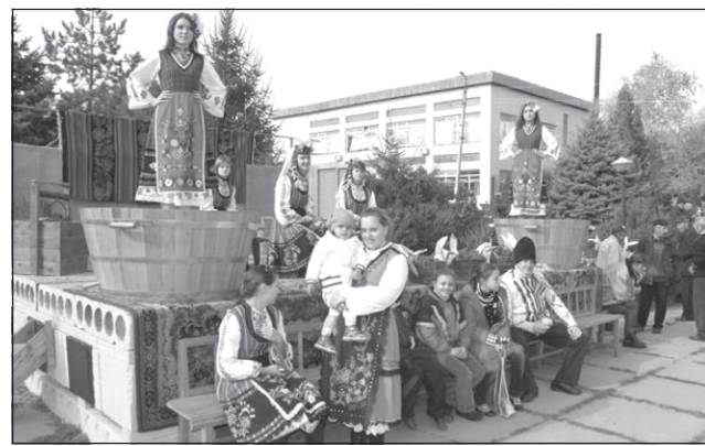
Момичета - цариците на гроздобера.

Когато идва октомври, целият град се готви да бере гроздето. От мазетата се изкарват бъчвите, които трябва да се отдънят и измият. За да няма лоша миризма, някои от стопаните слагат орехова шума в гореща вода и с нея се измива бъчвата. По този начин се мият гроздомелачките, корабите (там се държи смляно грозде) и теските (дървена преса за мачкане на гроздето). В Твърдица самият гроздобер има особености. Така например по причина, че градините са големи, прието е да се канят за помощ както роднините, така и познатите хора. След това стопанинът или стопанката отиват на следващия ден да помагат на този, който е бил поканен. При нас казваме така: "Да връщаме деня", тоест да помогнем и на онзи, който е дал своя ден, помагайки на нас. Преди да започне работата, стопаните хранят гостите с топла пилешка чорба или картофена яхния с месо. После дружно започват гроздобера. При нас е прието жените да берат гроздето, а мъжете да го изнасят. Преди няколко години се изнасяше с кошници, а сега с чувалчета. Мъжете обработват гроздето през гроздомелачките. Обикновената мелачка само напуква гроздето и дава възможност сокът да изтече. При нас той се нарича шара или муст. Захарността на този сок се проверява с яйце: ако то потъне, значи захарността е малка и виното ще бъде кисело, ако се вижда краят на яйцето, значи виното има захар и ще бъде хубаво. Използваните чепки не се изхвърлят, слагат се в тясната, която изстиска останалия сок от гроздето. По то-