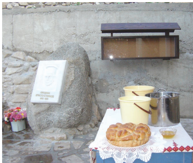
Чешмата с барелефите в църковния двор.