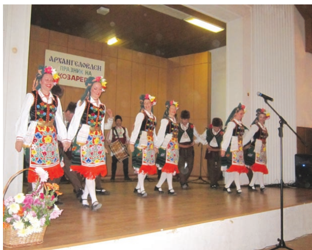
Концерт на фолклорен ансамбъл „Тунджа“ - Ямбол.