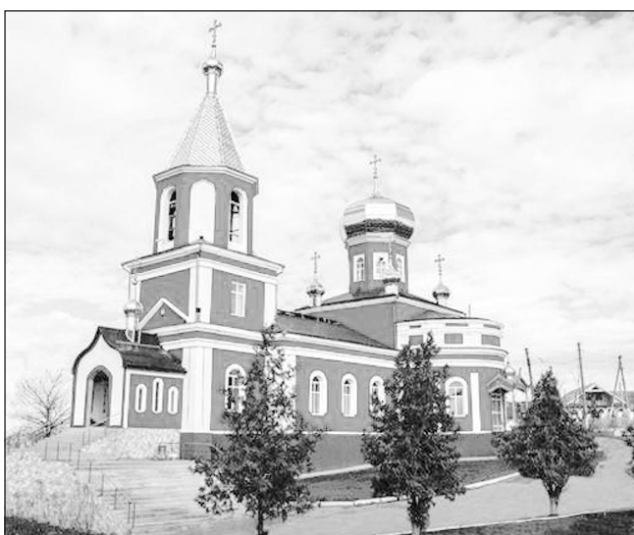
Възстановеният храм "Свети Георги Победоносец" в Тараклия

В този празничен ден пожелаваме на църковнослужителите на църквата "Св. Георги Победоносец" здраве и все така ревностно служене на Бога, както и всеотдайност на делото за духовното възпитание на паството.