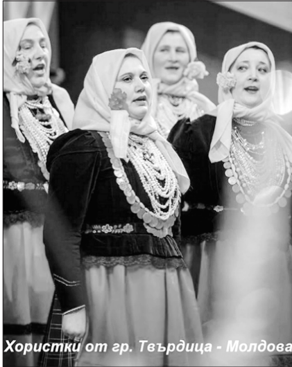
Хористки от гр. Твърдица - Молдова