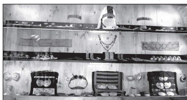
Накити от Дряново

тан. Апликацията по полите - кунтията е от сукно или от атлаз. Дряновското сукно е от цветни квадратчета, подредени в определен ред - червено, аракосано (оранжево), червено, синьо. Съчетанието се повтаря, като на мястото на синьото се слага зелено. Кунтията - атлазена или сукнена се подчертава с "пръчка", т.е. над нея се пришива декоративна фабрично изтъкана лента с метална нишка. На гърба на сукмана, на нивото на плешките, са прикрепени сукманените "опашки". Долната им част достига до кунтията и е украсена с различни фигурки от пришити мъниста или пайети, които според народната вяра имат способността да предпазват от лоши очи - "уроки". Коланът се закопчава с пафти, изработени от местните златари. Коланната шевица се бродира върху бяло платно с копринени или вълнени конци и фи-