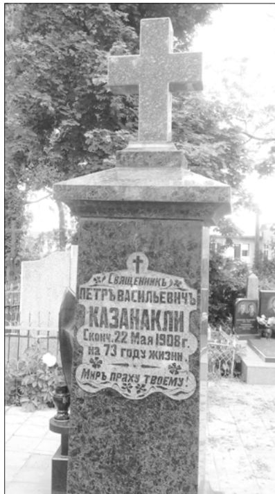
Надгробният паметник на свещеник Петър Казанакли (Кишиневското градско гробище)

ставители на дворянските родове. Каква беше изненадата ми, когато съзрях едно надгробие от масивен черен графитов мрамор, увенчен с теракотов