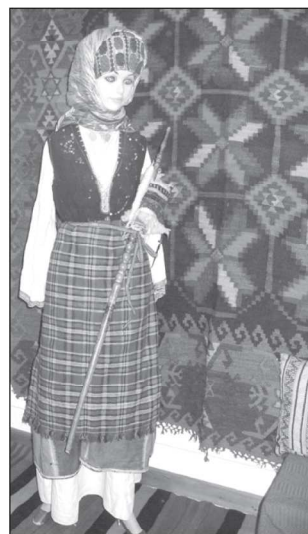
Стара котленска носия

кави е ярко доказателство за уменията и вкуса на котленката. Над ризата се обличал "сукман" от черен или тъмносив плат. Неговата украса са "белките" пестроцветни копринени парчета плат - апликирани към краищата на полите. На кръста си котленката запасвала тъкана престилка и сърмен колан с пафти. Бракът, връхната точка в живота на жената, намира по подобаващ начин отражение в облеклото. На главата си омъжената котленка поставяла характерното "двурого" забраждане, което носи до края на живота си като знак на нейния