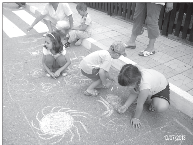
Децата от ЦДГ "Атанас Дамянов" - Оризари рисуваша на асфалт своите любими животни, цветя и герои от приказки.