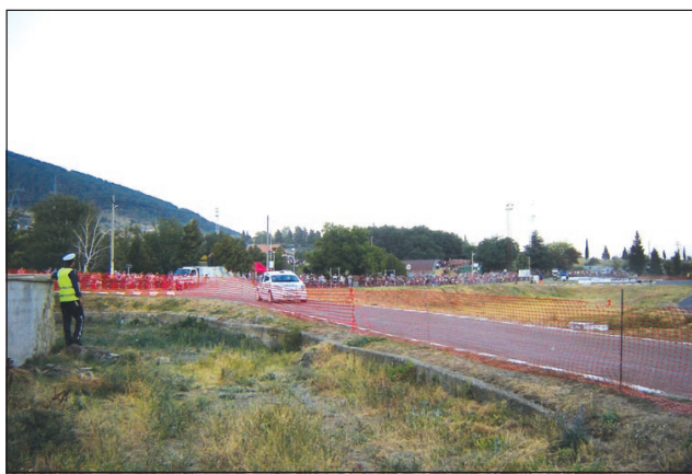
След откриването на състезанието множеството се отправя към старта на суперспециалния етап "Детелината".