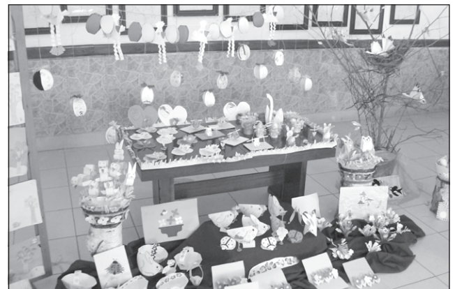
Организирана беше и изложба с техни рисунки, картички и фигури от хартия. Рисунането на асфалт беше част от заниманията, които читалището и педагозите от детската градина провеждат с децата през лятния сезон