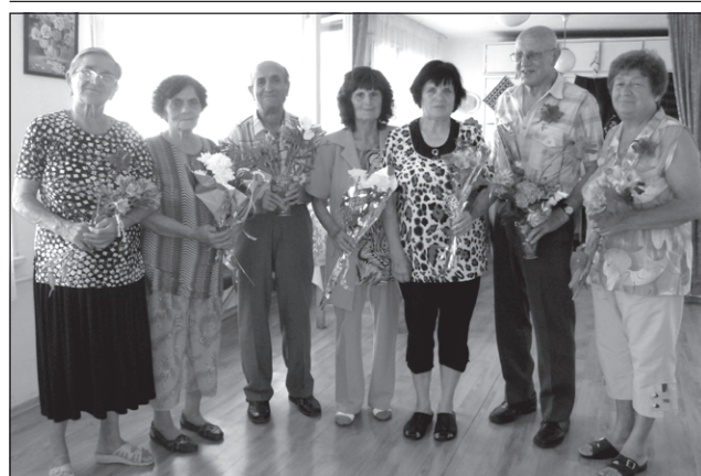
В пенсионерски клуб "Надежда" празнуваха рождени дни.

Това посещение беше организирано благодарение на