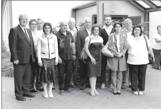
За спомен от срещата.

Организацията е с много богата история, датираща от 1872 г. Създадена е от Фридрих фон Боделшвинг отначало като център за епилептици. През 1873 г. близо до гр. Билефелд построяват голяма