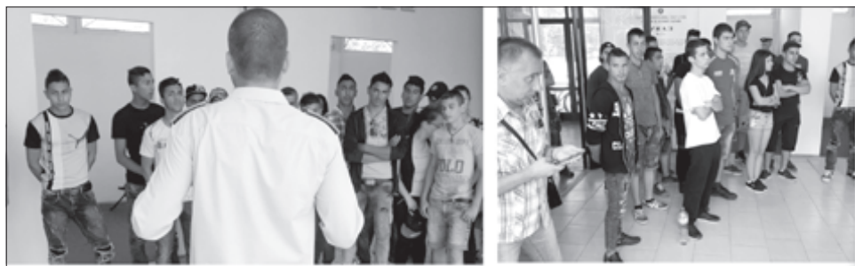
Ученици от IX и X клас на СУ "Н. Рилски" - Твърдица по време на посещение във военно формиране 22220 - Сливен.

Текст и снимки: Слав СЛАВОВ, Офис за водене на военен отчет в община Твърдица