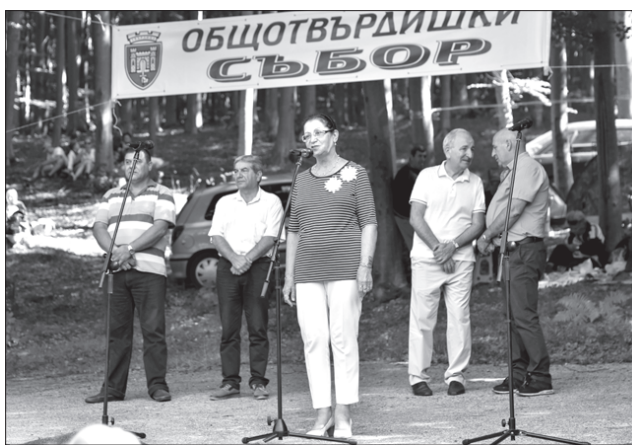
днево; от община Нова Загора - с. Стоил войвода и гр. Нова Загора; от община Лясковец - с. Джулюница и гр. Лясковец и