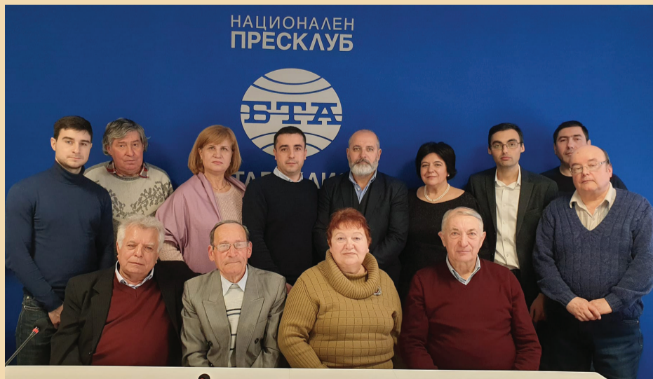
Участници в Кръглата маса

„Васил Левски – Апостолът на българската свобода“, състояла се в Тараклия.