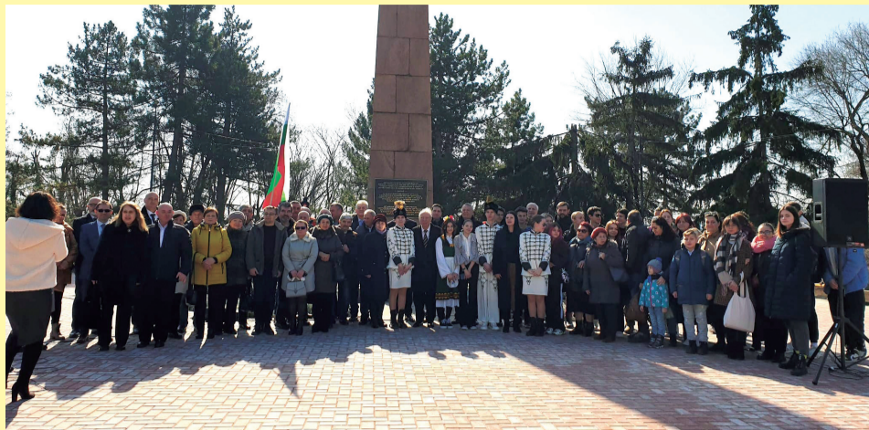
Българската общност до Обелиска на българските опълченци в Кишинев

На 2 март бяха положени цветя пред паметната плоча на основоположника на организираната борба за освобождението на България – Георги Раковски. След това в Тараклийския държавен университет „Григорий Цамблак“ се състоя Кръгла маса под надслов