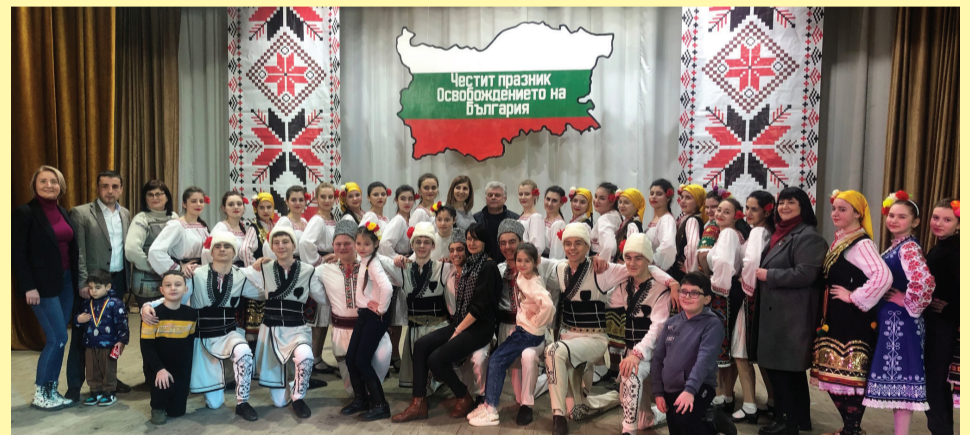
Празничен концерт на твърдичаните в Тараклия