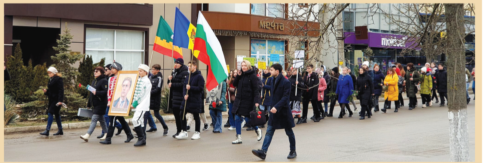
Участници в шествието „По пътя на безсмъртието“ в Молдовска Твърдица.

Информация от д.и.н. Иван Думиника - на стр. 5