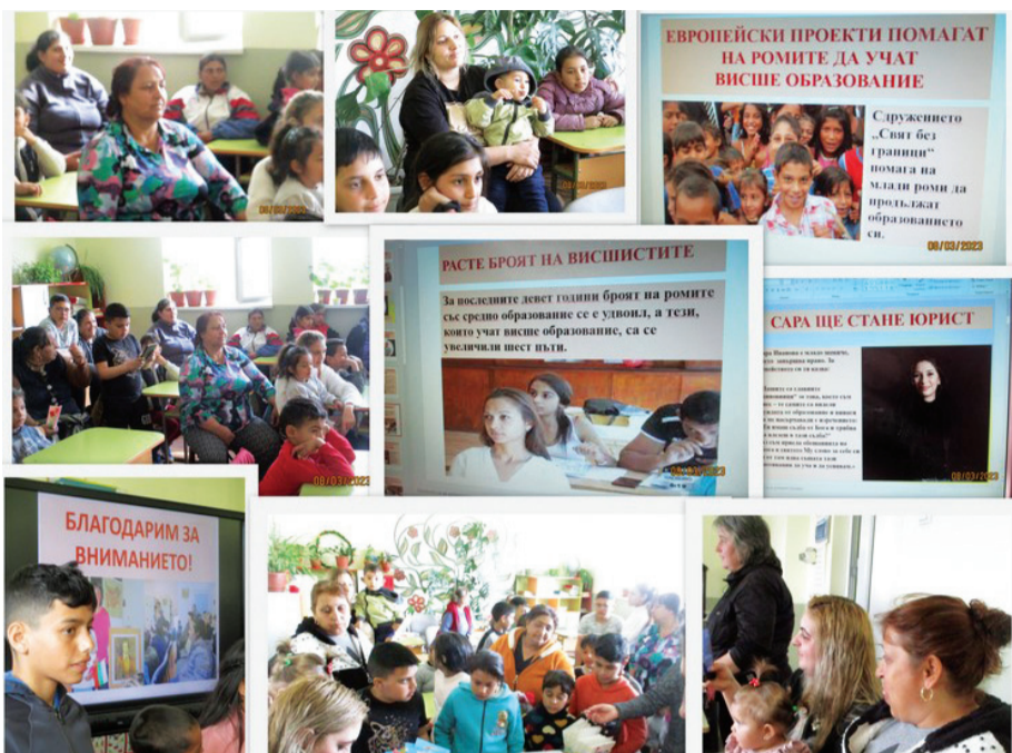
Среща с родителите в НУ „Христо Ботев“ с. Оризари