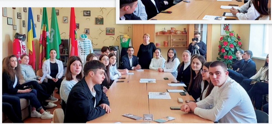
Участници в ученическата кръгла маса в Теоретичен лицей в Твърдица