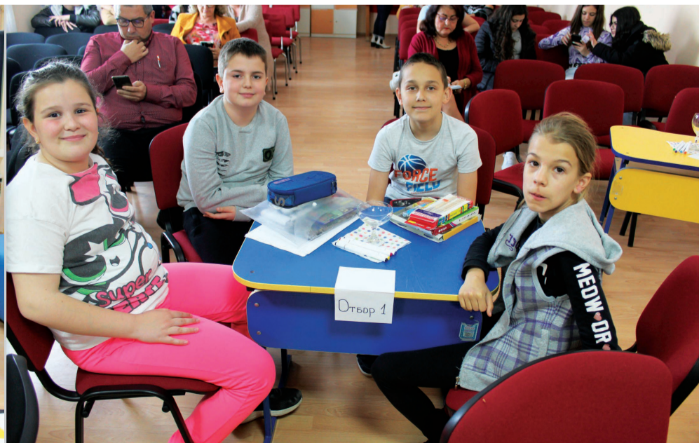
Училищен проект „Междупредметие“ – открит урок на тема „Ритъм“